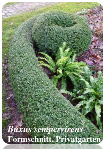
Buxus sempervirens Formschnitt, Privatgarten