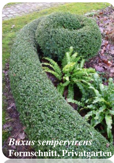
Buxus sempervirens Formschnitt, Privatgarten